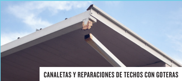
CANALETAS Y REPARACIONES DE TECHOS CON GOTERAS

PARA CONTINUAR A MEJORAR NUESTRAS ESCUELAS