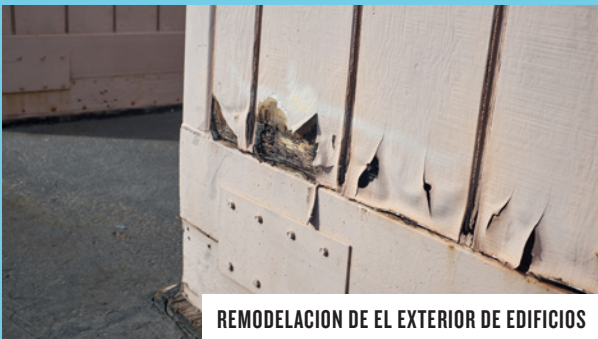
REMODELACION DE EL EXTERIOR DE EDIFICIOS