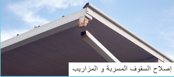
إصلاح السقوف المسربة و المزاريب