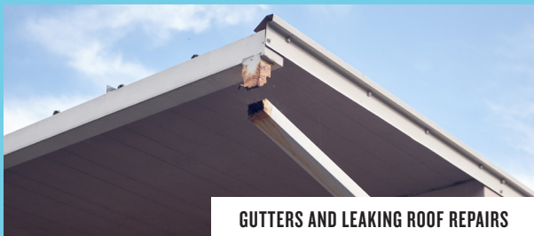
GUTTERS AND LEAKING ROOF REPAIRS