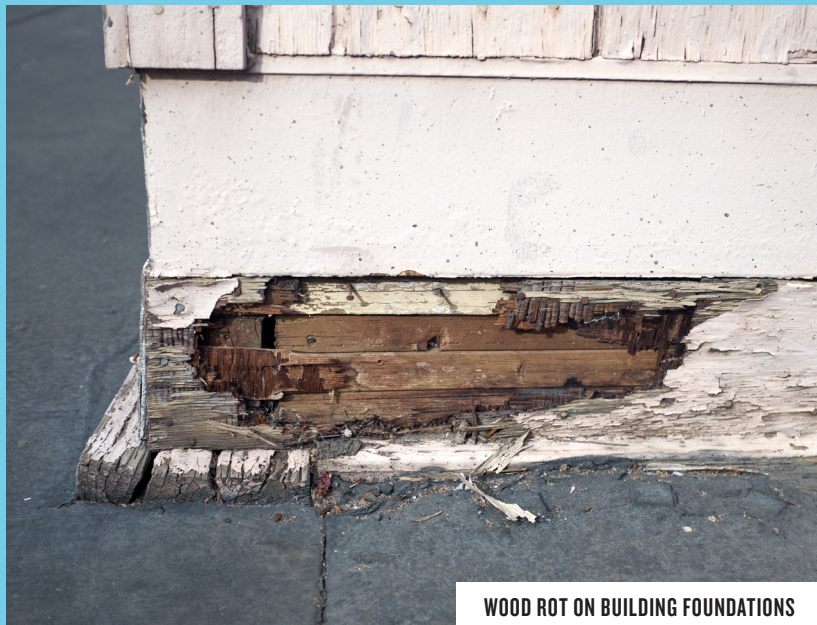
WOOD ROT ON BUILDING FOUNDATIONS