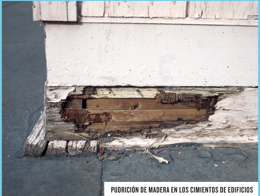
PUDRICIÓN DE MADERA EN LOS CIMIENTOS DE EDIFICIOS