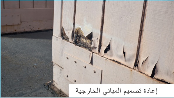
إعادة تصميم المباني الخارجية