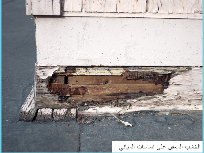
الخشب المعفن على اساسات المباني